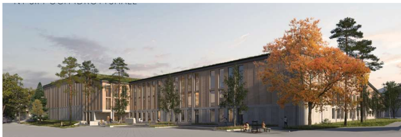
Gestaltning av ny sim- och idrottsanläggning.